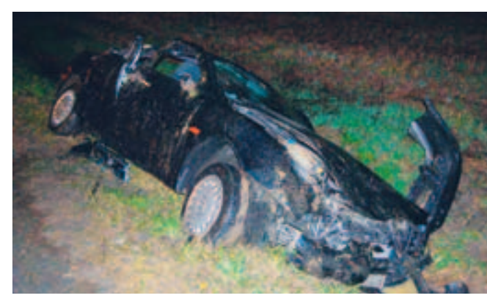
L'Alfa 156 distrutta in strada della Rezza

CHIERI «Basta incidenti in strada della Rezza ogni volta che piove». I residenti della borgata all'altezza del bivio con Canarone sono esasperati. Tra sabato e domenica, infatti, gli incidenti sono stati due. Nello stesso punto. Il primo, intorno alle 12,40: una Lancia Ypsilon procedeva in direzione Chieri e, subito dopo il bivio, ha sbandato finendo con le ruote sul fango a bordo strada. Il copione si ripete il giorno dopo, domenica. Sono da poco passate le 18, quando un'Alfa 156 esce di strada proprio come la Ypsilon e si ritrova nel fosso, distrutta. F. Gottardo