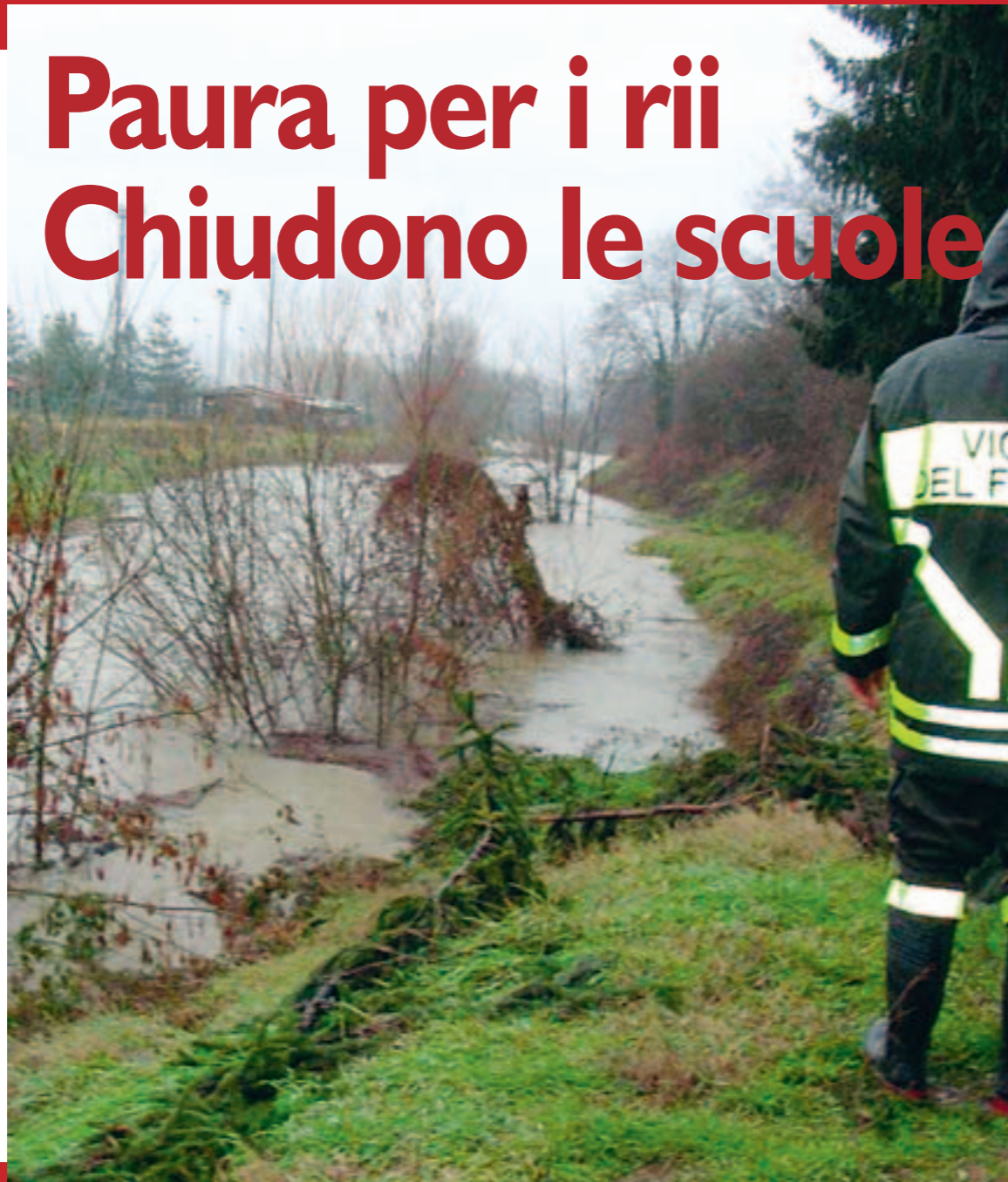
CHIARA E GOTTARDO A PAG. 4