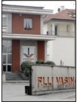
MANENTI A PAG. 5

Un altro colpo per il settore storicamente portante dell'economia chierese, crollato negli ultimi vent'anni. Di quei tempi sono rimasti 2.500 addetti, superstiti di un'emorragia continua. Ma i sindacati incoraggiano a non mollare.