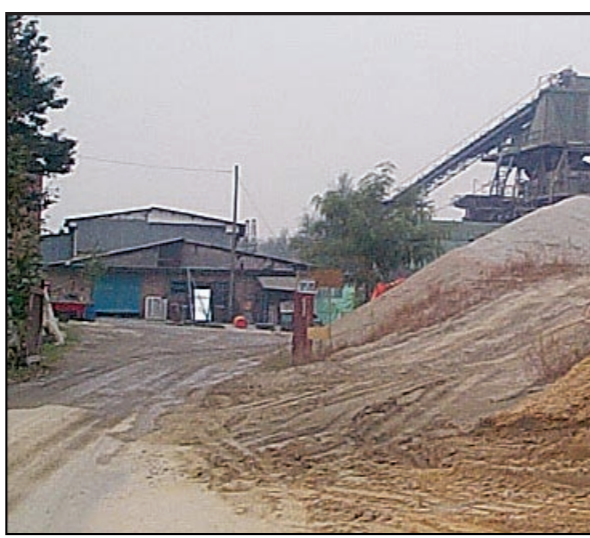
La cava Monticone, ai confini tra La Loggia e Moncalieri