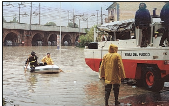
Ottobre 2000: a Borgo Mercato ci si sposta sui canotti

MONCALIERI - Mentre sull'alluvione del 2000 si affaccia lo spettro dell'inchiesta tangenti, il Comune opera in direzione della trasparenza pubblicando su internet l'elenco dei rimborsi ai privati. Il Corriere li pubblica a partire da questo numero. Parallelemente l'opposizione chiede una commissione consiliare speciale sui rimborsi del postalluvione. Quest'ultima proposta viene da Rifondazione Comunista, che l'ha messa nero su bianco in un'interrogazione, per togliere ogni ombra su «atti amministrativi elaborati dagli uffici comunali, danni subiti, controlli effettuati, rimborsi elargiti e non, localizzazioni e nominativi». M. COSTAMAGNA PAG. MONCALIERI III