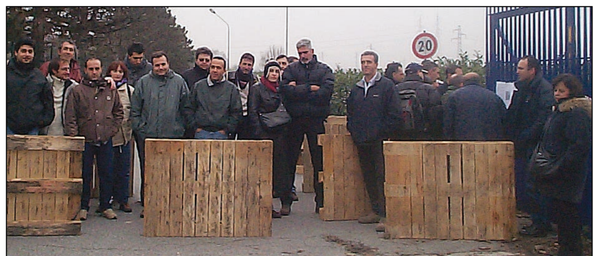
Lavoratori picchettano gli ingressi della tipografia Ilte in via Postiglione

MONCALIERI - Nuova bufera sulla Ilte. Dopo le assemblee di lunedì 18 tutti i dipendenti si sono astenuti dal lavoro, mentre da martedì 19 la protesta si è fatta più dura, con un picchetto permanente di circa 150 scioperanti di fronte ai due ingressi della ditta. Sciopero anche alla Viberti di Nichelino per i tagli alla produzione e l'incertezza sui contratti a termine.